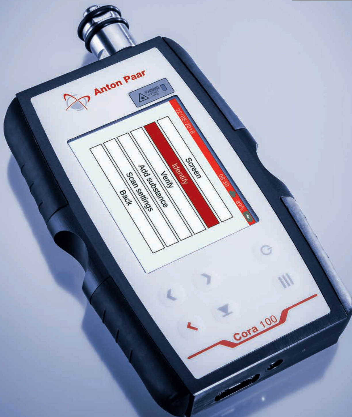
手持式拉曼光谱仪